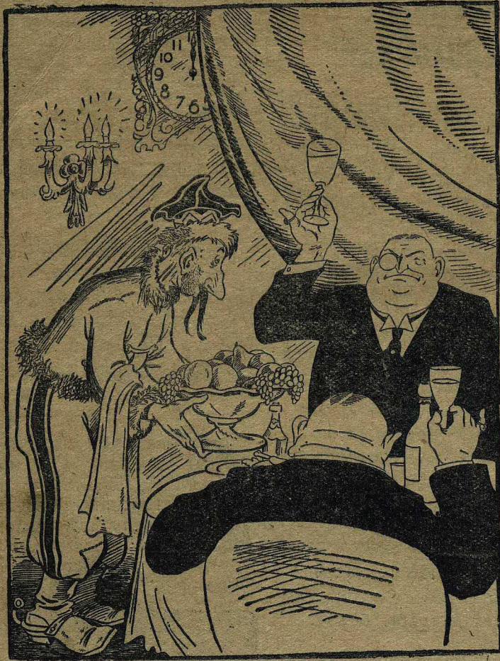
Ясновельможный пан встречает новый год.